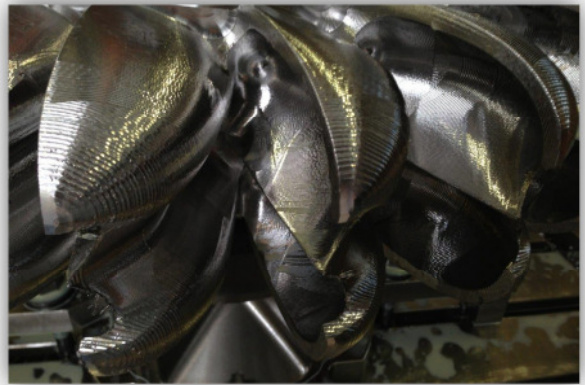
während der Fräsbearbeitung