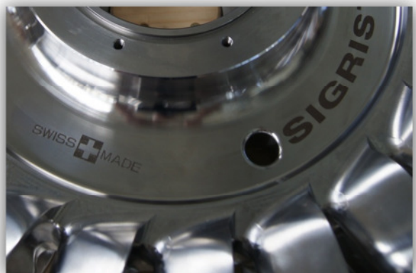
einbaubereiter Sigrist Integral Runner®

SIGRIST Integral Runner® ist ein eingetragener Markenname der Firma Sigrist AG Turbinenbau und 100% Swiss Made.