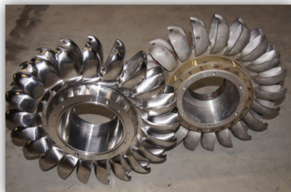
rechts das ausgemusterte Gussrad links der neue Sigrist Integral Runner®